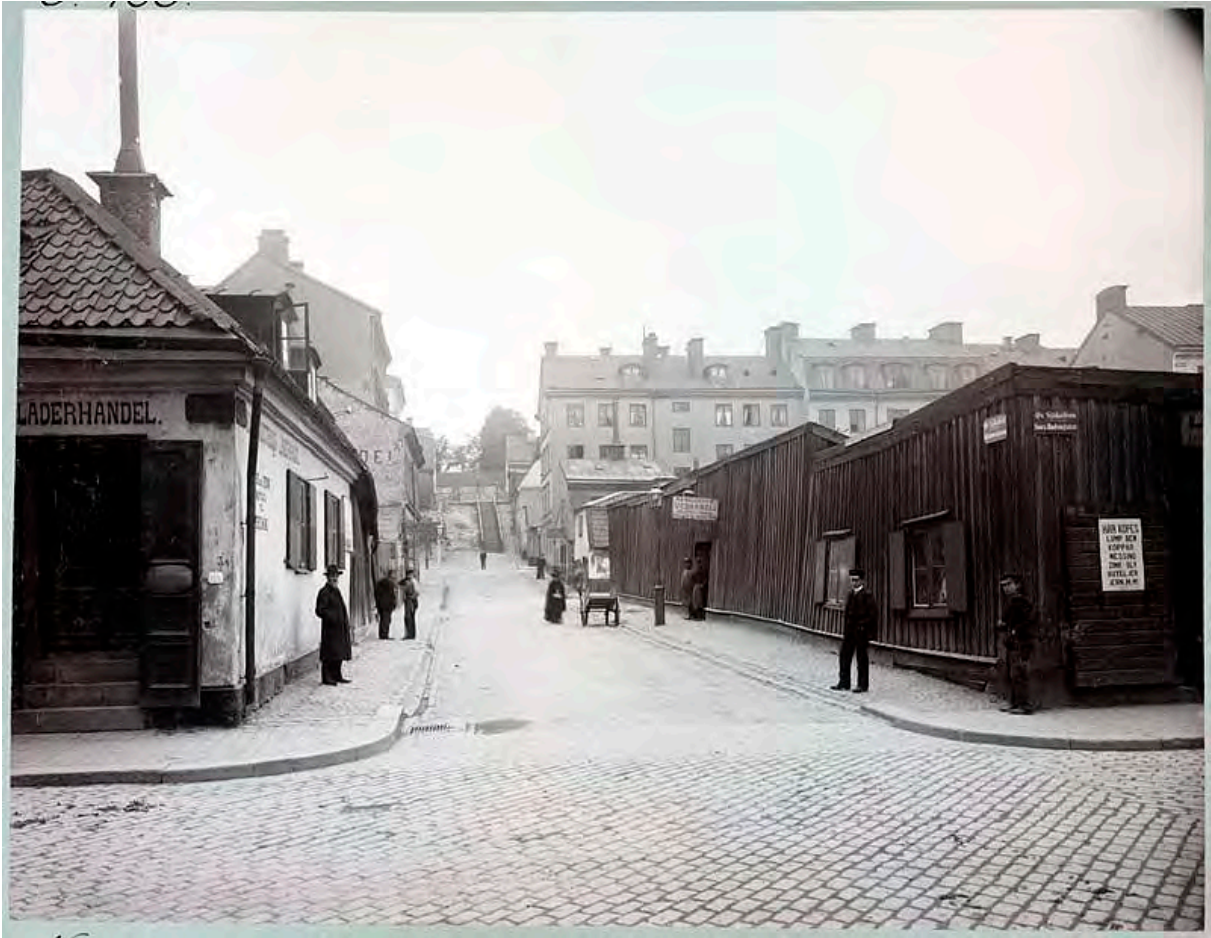
Foto Rådmansgatan västerut taget i korsningen Rådmansgatan-Döbelnsgatan. De låga trähusem till höger står på nuvarande Kv Sjøråen 24. Det hitersta ser ut att vara ett bostadshus huset västerom någon form av verkstad.arbetsplats-stall e d