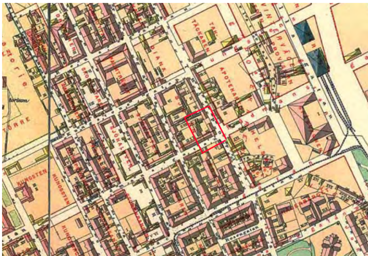
Karta från 1885, nuvarande Sjöråen24 markerad med röd ram